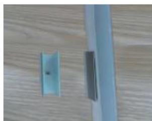
Verwenden Sie Befestigungsklammern und Schrauben, um das Neon-Flexkabel im gewünschten Muster zu installieren.