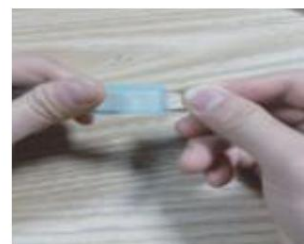
Stecken Sie den Stromstecker in das andere Ende und schließen Sie die 4 Drähte darin an.