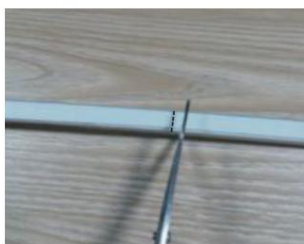
An der Schnittmarkierung schneiden