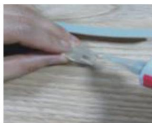
Zum Schluss verwenden Sie eine Endkappe und Silikonkleber, um ihn wasserfest zu machen.