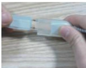
Schließen Sie es an das Stromkabel an und verwenden Sie Kleber, um es wasserfest zu machen.